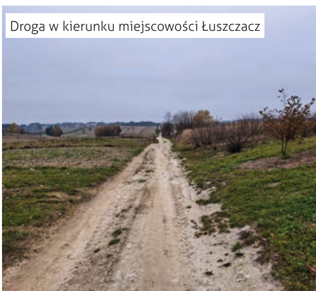
Droga w kierunku miejscowości Łuszczacz

Skręcamy w prawo i na skrzyżowaniu w lewo, w kierunku wsi Róża. Róża – wieś powstała ok. XIV w. Wieś bardzo okrutnie doświadczona podczas II wojny światowej. Asfalt kończy się na skraju wsi i jedziemy dalej gruntową drogą leśną. Przejeżdżamy przez las sosnowo – jodłowy wspomagając się „niebieskim” szlakiem. Dojeżdżamy do wsi Husiny – wieś figuruje w spisie z 1827 r. Na drodze asfaltowej skręcamy w lewo. Po chwili, na ostrym zakręcie widoczny jest krzyż i tutaj skręcamy w lewo i przy ścianie lasu, po prawej stronie znajdują się źródła rzeki Sopot. Źródła są pomnikiem przyrody nieożywionej.