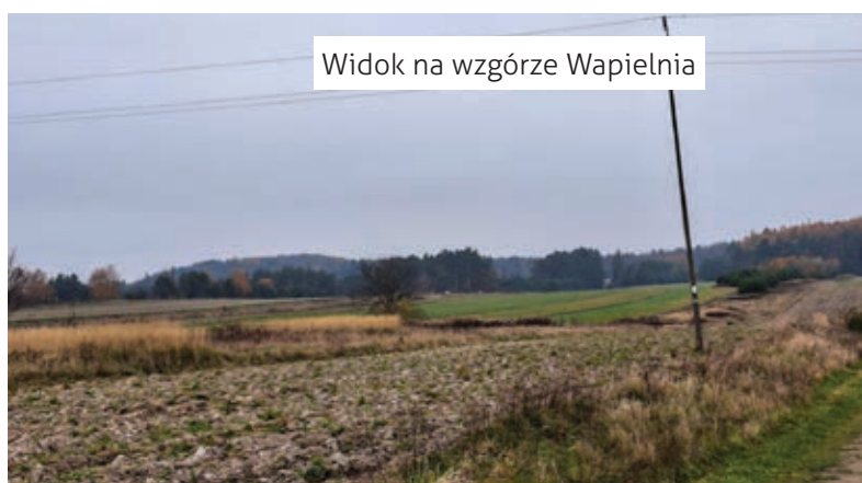
Widok na wzgórze Wapielnia