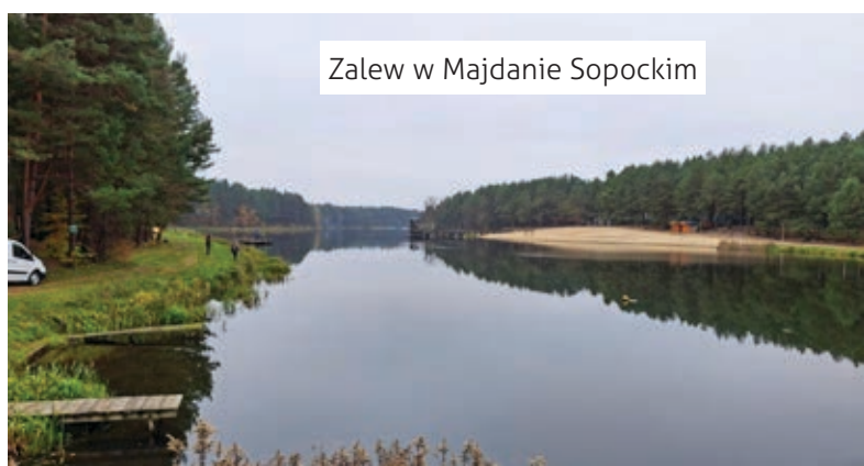
Zalew w Majdanie Sopotkim