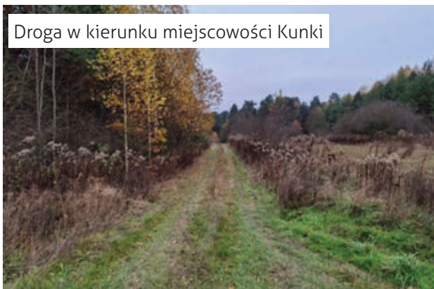
Droga w kierunku miejscowości Kunki

Wapielnia – najwyższe wzgórze Roztocza Środkowego (386,2 m n.p.m.). Wzgórze jest pomnikiem przyrody. Nazwa wzgórza pochodzi od wapieni nadających się do wypalania wapna. Warto zatrzymać się tutaj na dłużej i pospacerować po szczycie wzgórza, oglądając wyrobiska i skały. Ze wzgórza jedziemy w kierunku północnym i po chwili skręcamy w lewo w kierunku widocznej już wsi Łuszczacz.