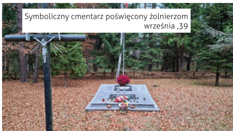
Symboliczny cmentarz poświęcony żołnierzom września '39