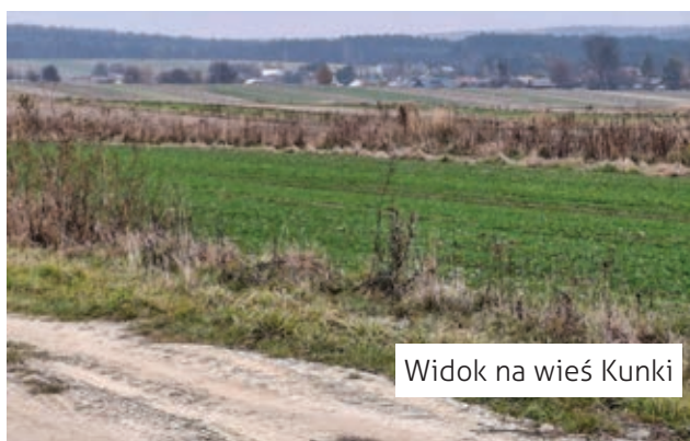
Widok na wieś Kunki