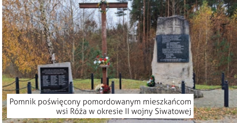
Pomnik poświęcony pomordowanym mieszkańcom wsi Róża w okresie II wojny Siwatowej