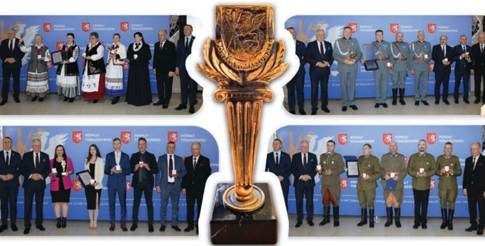
Laureaci XVIII Gali Srebrny Gryf Powiatu Tomaszowskiego