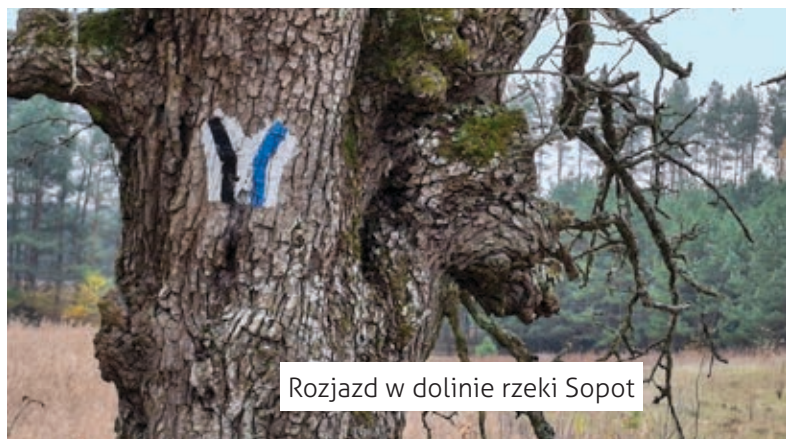
Rozjazd w dolinie rzeki Sopot