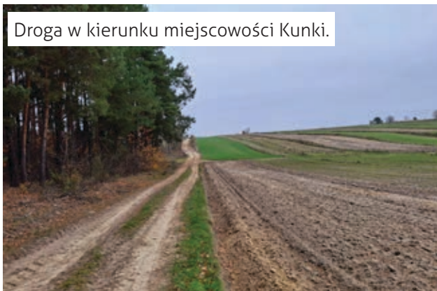
Droga w kierunku miejscowości Kunki.

Ulów – wieś założona w XVII w. w 1743 roku we wsi znajdowały się winnice i karczmy. W 2002 roku odkryto tutaj dwie osady i cmentarzysko utożsamiane z ludem germańskich Herulów. Za remizo-