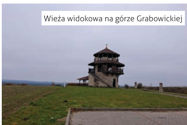
Wieża widokowa na górze Grabowickiej